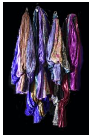
Nutcracker, Backstage Mischief ©Chris Klein

D'origine britannique, maintenant résident canadien installé à Montréal depuis 1999, Chris Klein a longtemps partagé son temps entre le Québec et l'Ontario. Il a remporté à ce jour plusieurs prix d'art internationaux et a participé à des expositions dans de nombreux pays européens, aux États-Unis et au Canada.