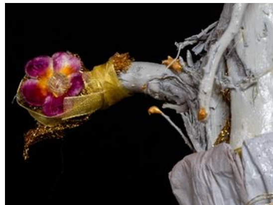
Veris leta (détail) Migno

Originaire de Gatineau (Québec), Migno est une artiste sculpteure et travailleuse culturelle de la région de l'Outaouais depuis plus de 20 ans. Récupératrice, chercheuse de trésors, Migno s'inspire notamment des mouvements Arte Povera et Recycl'art. Utilisant des techniques variées, elle assemble, désassemble, colle, superpose, ajoute des fragments, construit et déconstruit. Récemment, elle a co-produit une série de documentaires qui mettent en lumière 22 artistes en arts visuels de l'Outaouais.