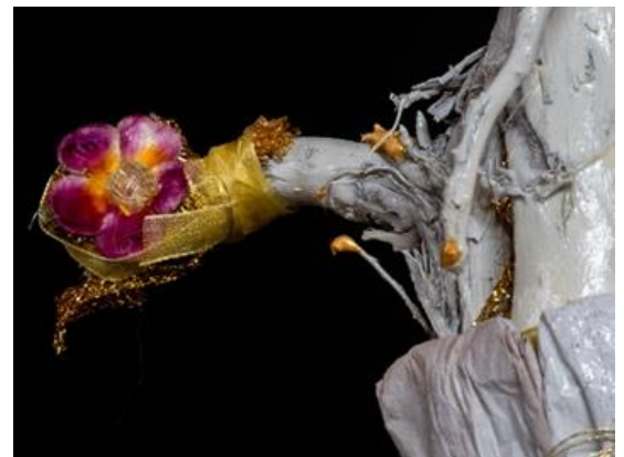
Veris leta (détail) Migno ©Claude Wauthier

Originaire de Gatineau (Québec), Migno est une artiste sculpteure et travailleuse culturelle de la région de l'Outaouais depuis plus de 20 ans. Récupératrice, chercheuse de trésors, Migno s'inspire notamment des mouvements Arte Povera et Recycl'art. Utilisant des techniques variées, elle assemble, désassemble, colle, superpose, ajoute des fragments, construit et déconstruit. Récemment, elle a co-produit une série de documentaires qui mettent en lumière 22 artistes en arts visuels de l'Outaouais.