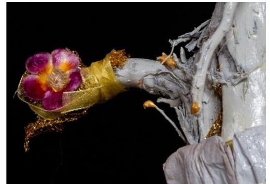
Veris leta (détail)