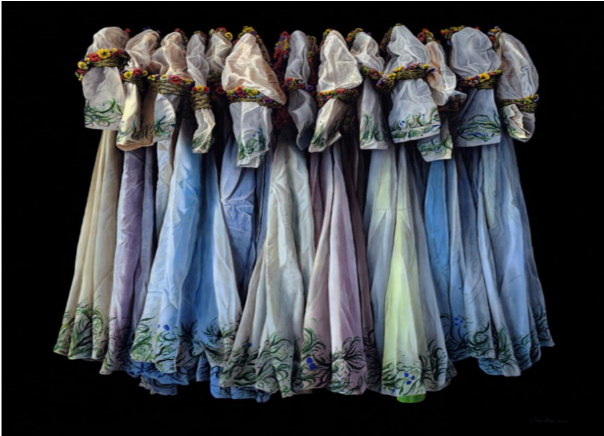
Primo Vere © Chris Klein