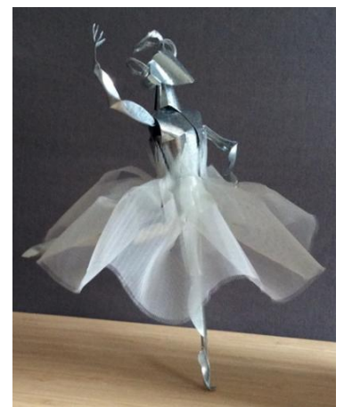
Carmina Burana

lesoleil.com/archives/atelier-les-doigts-de-fee