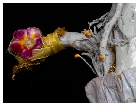
Veris Leta par Migno Fernand Nault : une passion, un legs, exposition itinérante

*Le Fonds philanthropique Fernand Nault est un levier unique pour susciter l'intérêt envers le patrimoine artistique, offrir du financement complémentaire visant à soutenir la réalisation de projets en danse et contribuer à l'avancement des arts dans la communauté. Les fonds reçus sont investis auprès de fondations communautaires.