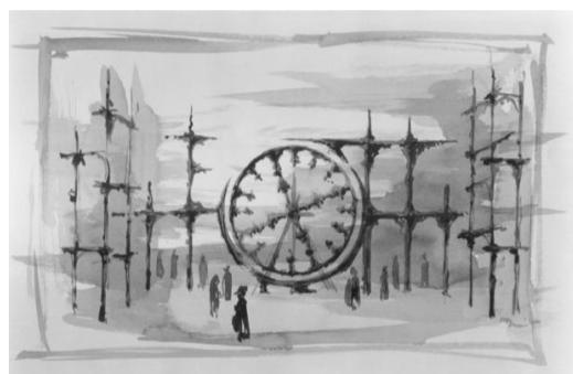
Esquisse décors de Carmina Burana par Robert Prévost Chasse au trésor du patrimoine de la danse